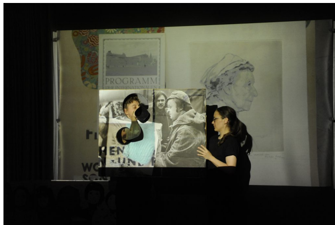
SPUKEN IM ARCHIV! , [esc] medien kunst labor, Fotografie / photography: Maryam Mohammadi

SPUKEN IM ARCHIV! ist ein Film- und Rechercheprojekt des SKGAL, das sich kritisch mit der*n Geschichte*n und dem Archiv der Vereinigung Bildender Künstlerinnen Österreichs (VBKÖ) auseinandersetzt.